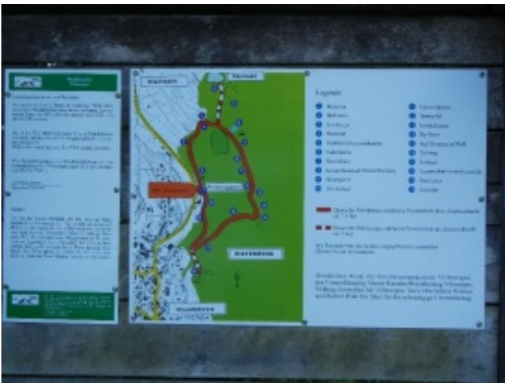
Bilder 31 bis 50 von 50 [ << 1 2 >> ]

http://www.1962er.ch/page/de/?section=gallery&cid=22&pos=30&smallscreen=0&pdfview=1